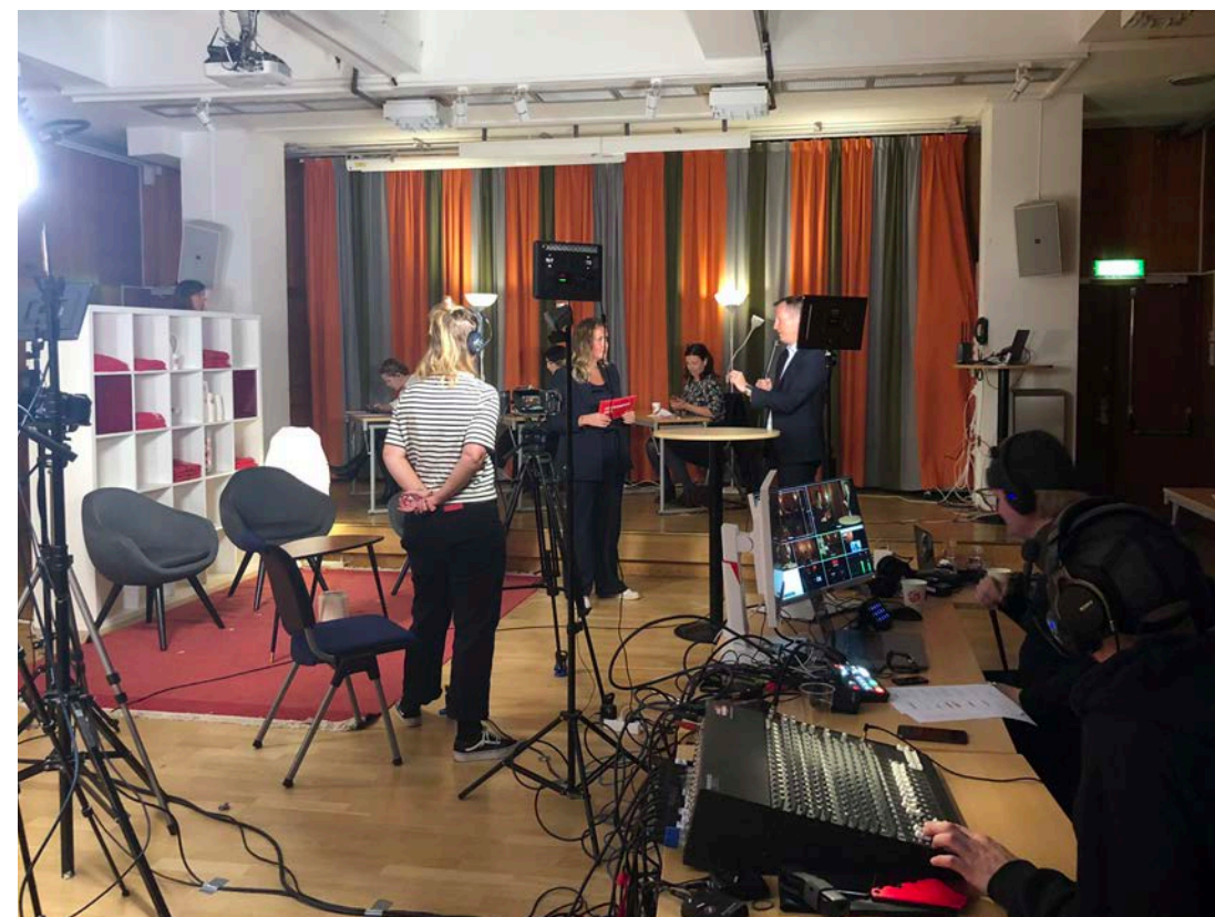
Höstkampanjupptakt med livesändning

Planen är sedan att den tredje gruppen väljs ut och startar redan under hösten 2021.