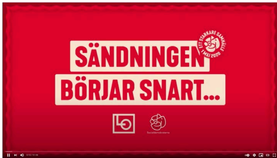
Första maj 2020