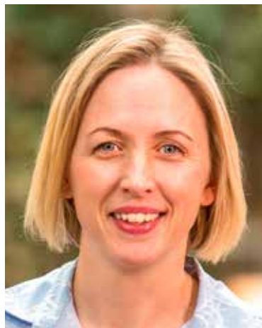
Jytte Guteland, Europaparlamentariker

Dörrknackningen i Stockholm var väldigt effektiv organisatoriskt och innehöll framförallt budskap om hur vi ville skapa ett hållbart Europa, klimatomfattigt och socialt. Exempel om hur barn och bin påverkas av kemikalier, blandades med utspel om hur alla branscher ska bidra till att få ner utsläppen och hur detta ska göras på ett socialt hållbart sätt.